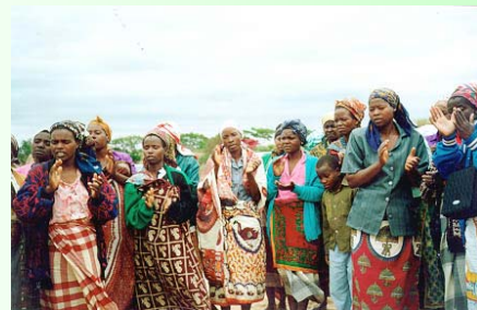
Grupo de mulheres discutindo os seus programas de desenvolvimento a nível da comunidade

A pagina na internet recentemente lançada para consulta no endereço www.forumulher.org.mz retracts, todos assuntos ligados a discriminação das mulheres e as varias actividades desenvolvidas por elas.