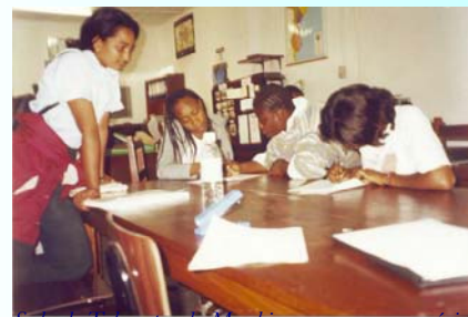
Sala do Telecentro da Manhiça com os seus usuários