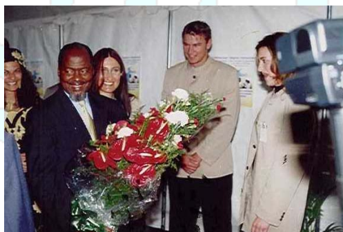
Presidente Chissano, durante a inauguração da Exposição

A exposição foi inaugurada pelo Presidente da República